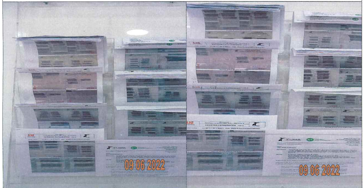
EDICTOS DE LA R_34497 YC-CRT-115427